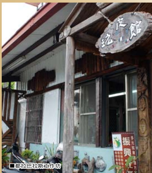
■都拉巴拉斯工作坊

關於三地門的種種傳奇，除了可以實地體驗，現在，也可以透過網站展開一段虛擬之旅。因為參與「96年度縮減產業數位落差計畫」，讓三地門裡10家業者攜手打造出一個獨一無二的群聚網。透過網路上精彩的文字敘